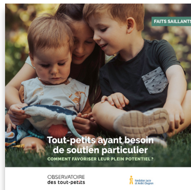
Une brochure présentant les faits saillants du rapport