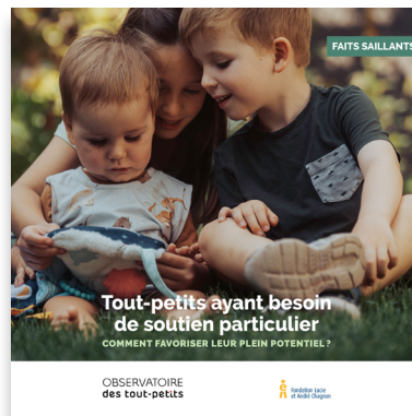
Une brochure présentant les faits saillants du rapport