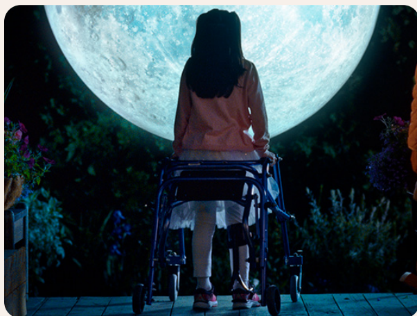
Une vidéo de sensibilisation

L'Observatoire des tout-petits a produit un dossier complet sur la situation des tout-petits ayant besoin de soutien particulier.